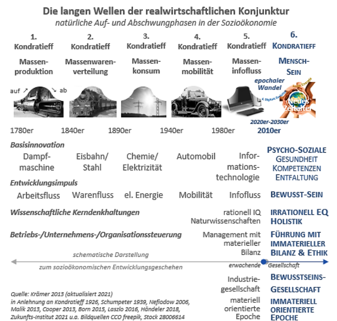
Abbildung 1: Vereinfacht dargestellt, bewegt sich die Wirtschaft und Gesellschaft in (reifen) Industrienationen entlang langer sozio-ökonomischer Entwicklungsphasen. Diese Pfade können graphisch, z.B. evolutiv mit Bifurkationen, linear, zyklisch, stufig, kreisförmig, chaotisch, ereignisgetrieben, einem Mix von Vorgenanntem oder wie hier wellenförmig dargestellt werden.

Diese erstmalig in der jüngeren sozioökonomischen Chronik auftretende immaterielle Basisinnovation wird u.a. benötigt, um einen umfassenderen Entfaltungsgrad der Mitarbeiter/teams, einen weitreichenden psycho-sozialen, ökologischen und ökonomischen Wirkungsgrad, einen hohen Kundennutzen und eine neue Innovationskraft für die großen Aufgabenstellungen unserer Zeitrechnung zu ermöglichen. Die bewusste Gestaltung nachhaltiger und ethisch erhöhter Wert-SCHÖPFUNGS-ketten sowie die tiefgreifende Reduktion von Transaktionskosten sind wichtige Folgen, da sich auch die Wirkungsweisen von Erfolgsmustern im nächsten Evolutions- und Involutionenzyklus für das Erlblühen einer völlig neuen Kulturepoche dynamisch verschieben (vgl. Abb. 1).